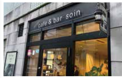
shoes care cafe&bar soin 名古屋市中区丸の内2-8-30 竹中ビル1階南 ☎(052)886-2427